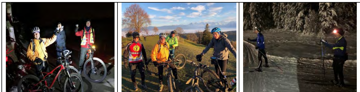
Impressionen : Biken by Night (mit wärmendem Pusch) – Nachmittagstour auf die Bütschelegg – Nacht-Langlauf in Heimenschwand

So sehr uns das Corona-Virus im 2020 auch eingeschränkt hat – hatten wir doch auch immer wieder schöne und auch spezielle Erlebnisse !